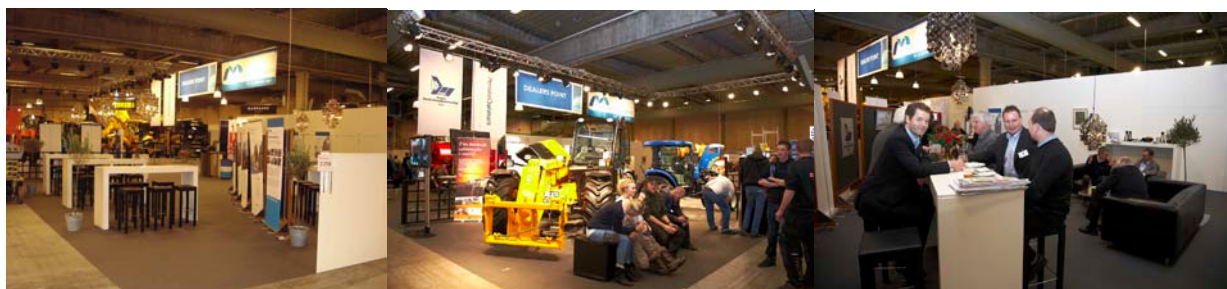
Foto: Branchestand i hal C på Agromek 2010

Som et led i aftalen med Agromek havde ML opbygget en branchestand i hal C, som denne gang var samlet under et "tag" sammen med Dansk Maskinhandlerforening, DM-Arbejdsgiver uddannelsesstand og "Dealer Point" med mødefaciliteter.