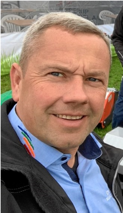
Ole Hosbond Sønderup Maskinhandel