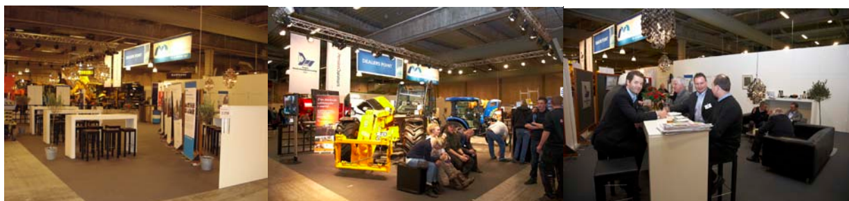
Foto: Branchestand i hal C på Agromek 2010

Agromek 2010 havde i alt 517 udstillere og lægger beslag på 13 haller, herunder den helt nye multiarena, som for første gang lægger gulv til en udstilling.