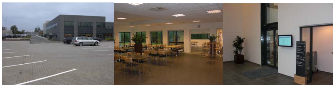
Foto: Nye parkeringspladser, nyt mødelokale og info-skærme i Trade City

Vi glæder os over at, kunne tilbyde disse faciliteter til vore medlemmer – og ser gerne at sekretariatet blive mere og mere ”branchens mødepunkt” i Danmark.